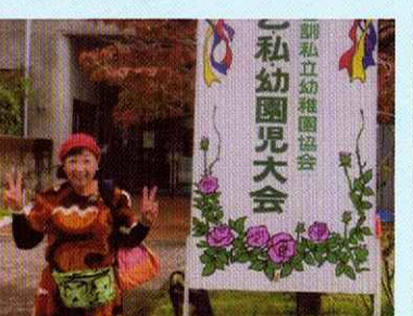
乙訓私立幼稚園大会にて