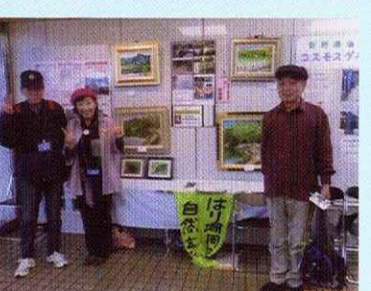
市民まつりでスタッフ活動