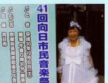
毎年 市民音楽祭出演