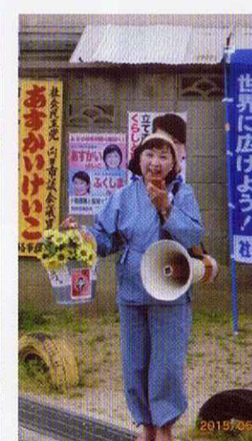
街角のあちこちで いつも平和スピーチ