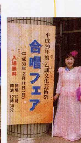
2月11日 乙訓文化芸術祭にて