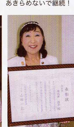
6月11日 市議30周年表彰を受ける