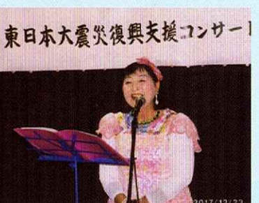
慶昌院で東北応援コンサート