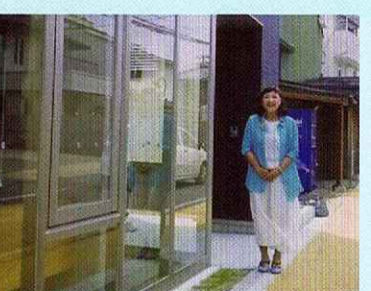
公約の女性活躍センターオープン