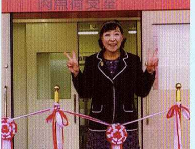
「中学校給食」実現させました！