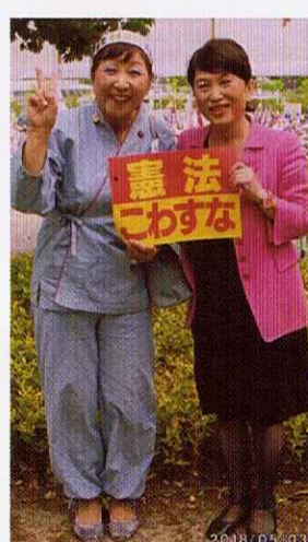
5月3日扇町公園にて 福島みずほさんと