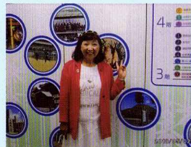
公約達成！阪急向日駅前市役所完成