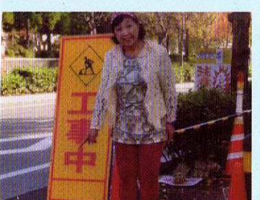
体育館前道路バリアフリー工事