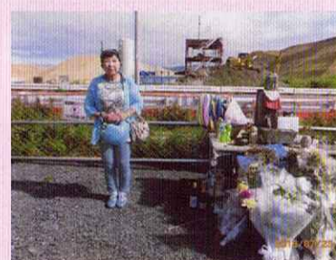
宮城県南三陸町防災庁舎前にて