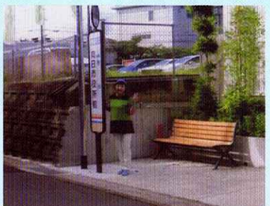
向日市役所 車イス用バス停設置