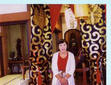
地藏盆は慶昌院さんへ子どもたちと