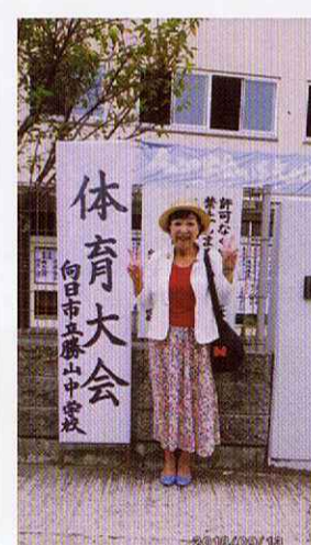
9月13日 全中学校の体育大会に参加