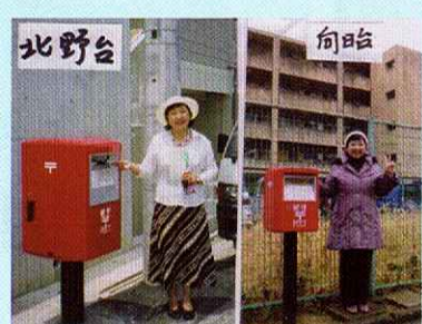
ポストをあちこち設置！