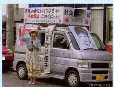
毎週火曜日の駅前演説