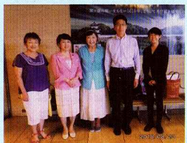
明石市へ視察 児童虐待防止プロジェクト