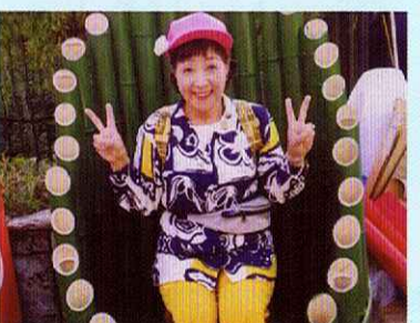
竹の径フェスタにて