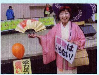
反原発はライフワーク