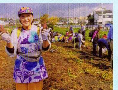
地区社協いも掘り大会