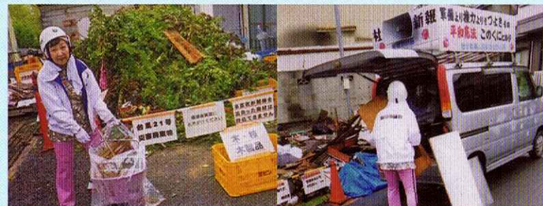
台風21号のガレキ運びがんばる！ (大牧地区ロータリーにて)