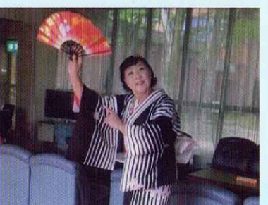
「桜の径」で日舞を踊る