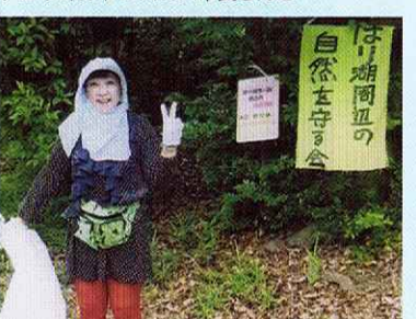
美しいはり湖山清掃！