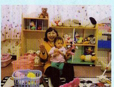
子育て支援に全力！