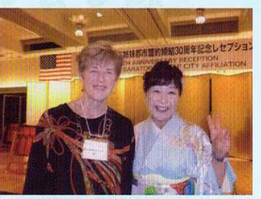
カリフォルニアの姉妹都市のアンウォルトンズミス市長さんと