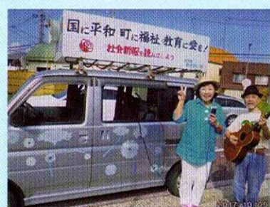
街中で歌とスピーチ活動