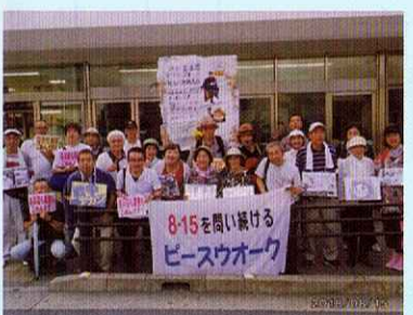
毎月15日 市内を平和行進