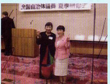
社民党全国自治体議員研修（福島みずほさんと）