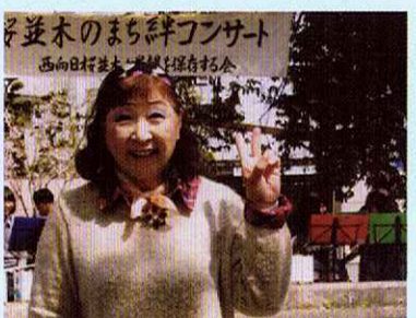
西向日 桜並木のまち絆コンサートにて