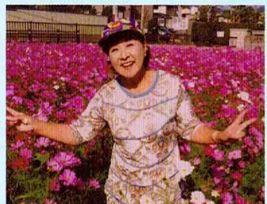
コスモス畑を実現！