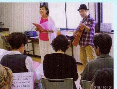
大牧自治会館新築・コーラス指導