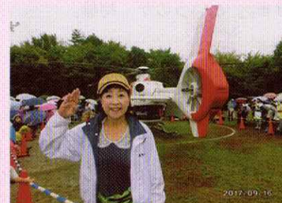
ドクターヘリが命を守る!(第六向陽小にて)