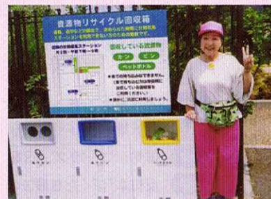
市内3カ所に分別ゴミステーション設置