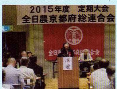
農業を守る大会スピーチ