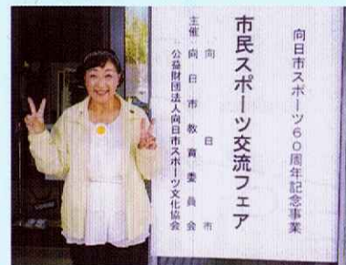
市民スポーツ交流フェア