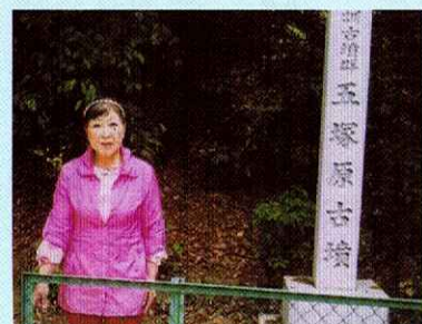
はり湖山の五塚原古墳 国の史跡指定