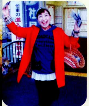
元気いっぱい 駅前ニュース配布 (毎火曜・朝5:30~8:30)