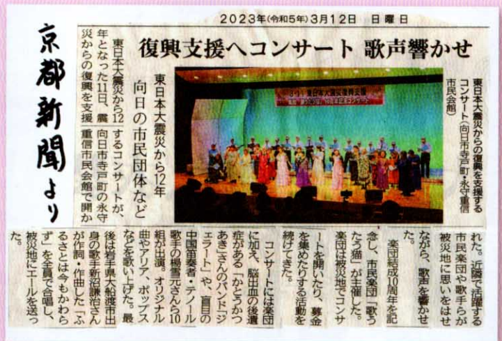
京都新聞より（2023年3月12日）