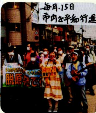
市のメイン通りを歩く