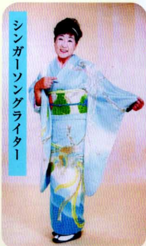
シンガーソングライター