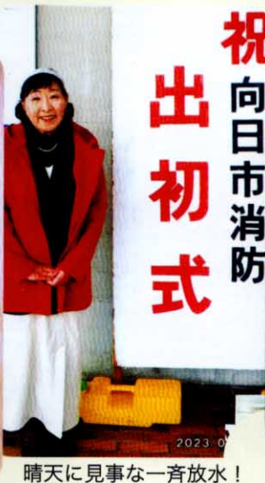
祝向日市消防出初式